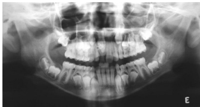
Figura 1. Lesão compatível com odontoma composto na região anterior da maxila. Observou-se também a permanência do incisivo central superior direito decíduo logo abaixo da lesão.