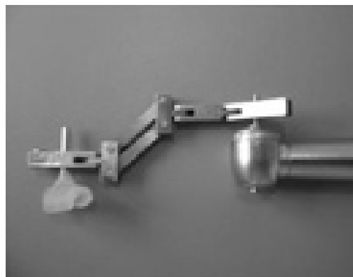
Figura 1. Casquete com pino de fixação, ParalAB e pino de fixação do alta rotação

Os dados obtidos estão representados pela estatística descritiva através de tabelas, mostrando os elementos de posição e de variação. Obteve-se a inferência estatística, através da estimativa de tendência, intervalo de confiança, utilização do teste de ANOVA para p < 0,05 para testar as hipóteses e aplicação do teste de Tukey (5%) no caso de evidência de rejeição de igualdade.