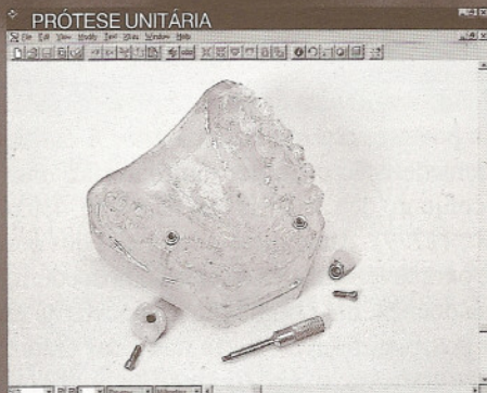
PRÓTESE UNITÁRIA MODELO SUP: Transparente com 2 implantes (11 e 26) CONEXÕES: 2 ucias hexagonais PRÓTESE: fixa com 3 elementos (parafusada)