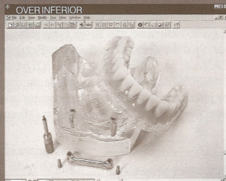
OVER INFERIOR MODELO INF: Transparente com 2 implantes CONEXÕES: 2 ucias mais 1 barra clips PRÓTESE: over inferior total (encaixe)

MANEQUINS COM IMPLANTES PARA TREINAMENTO E EXPLICAÇÕES AO PACIENTE