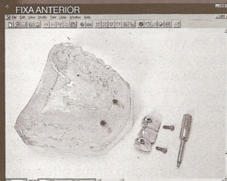
FIXA ANTERIOR MODELO SUP: Transparente com 2 implantes (11 e 22) CONEXÕES: 2 ucias convencionais PRÓTESE: fixa com 3 elementos (parafusada)

KIT COM 5 MANEQUINS TRANSPARENTES - COM 14 IMPLANTES COLOCADOS - PARA O DENTISTA EXPLICAR ESTA NOVA ESPECIALIDADE AOS PACIENTES, BEM COMO AS DIVERSAS ALTERNATIVAS DE PRÓTESES SOBRE IMPLANTES.