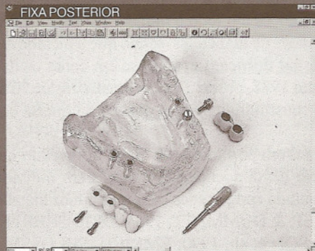
FIXA POSTERIOR MODELO SUP: Transparente com 4 implantes (36, 35, 45, 46) CONEXÕES: 2 munhões mais 2 ucias mais 1 encaixe MF PRÓTESE: 2 fixas com 6 elementos (paraf. e cimentada)