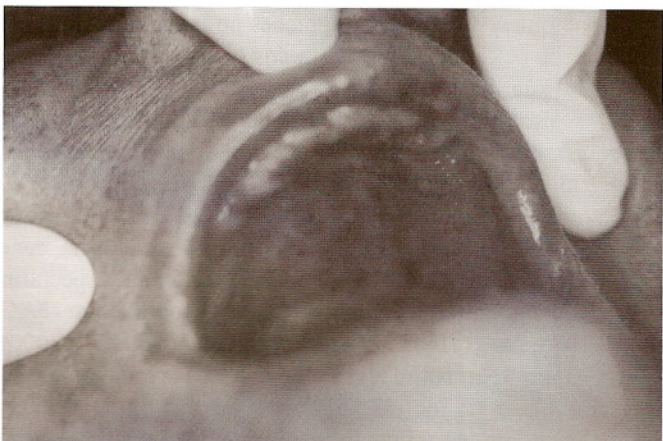
Fig. 3 - Candidíase eritematosa associada a uso de prótese total localizada no palato de um paciente diabético.

Dentre os 38 pacientes diabéticos melito examinados foram encontrados 62 eventos clínicos sugestivos de candidíase oral, nas suas variadas formas, assim distribuídos: 16 sugestivos de candidíase pseudomembranosa, 28 sugestivos de candidíase