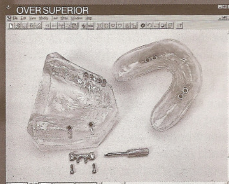
OVER SUPERIOR MODELO SUP: Transparente com 4 implantes CONEXÕES: 4 o' rings PRÓTESE: over superior total sem palato (encaixe)